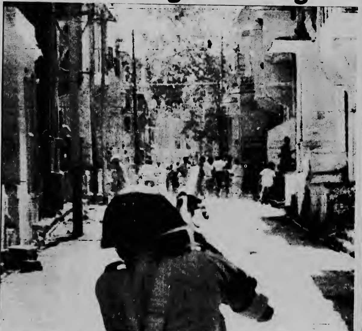
Na Jaipur, India, manifestantenan a hasi masha bochincha den cayanan debido na dificultadnan politica entre e gobierno di eprovincia y gobierno central di India. Diferente persona a muri den e bochinchanan aki y aki un solda ta mik un bom lacrimogeno riba un grupo di manifestante cu ta huyendo pa e peliger.